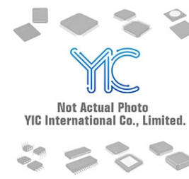
2SC4083PWT1G ON 2SC4083PWT1G ON