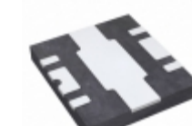
RFPA2226 RFMD GENERAL PURPOSE AMP DFN