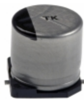
EEE-TK1C331UP Panasonic Electronic Components CAP ALUM 330UF 20% 16V SMD