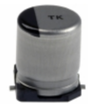
EEE-TK1E221UP Panasonic Electronic Components CAP ALUM 220UF 20% 25V SMD