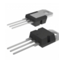
MIC29710-3.3BT Microchip Technology IC REG LDO 7.5A 3.3V TO220-3