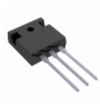
MIC29750-3.3BWT Microchip Technology IC REG LDO 3.3V 7.5A TO247-3