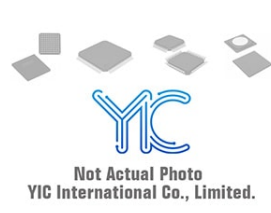
MIC2954-08YM TR Micrel Micrel SOP8