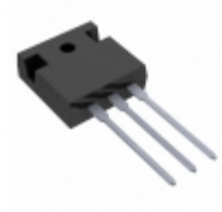
MIC29750-3.3WWT Microchip Technology IC REG LDO 3.3V 7.5A TO247-3