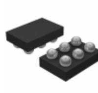
ADP7112ACBZ-1.2-R7 Analog Devices Inc. IC REG LDO 1.2V 0.2A 6WLCSP