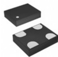
TC-54.000MBE-T TXC CORPORATION OSC MEMS 54.000MHZ CMOS SMD