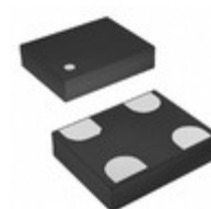
TC-54.000MBD-T TXC CORPORATION OSC MEMS 54.000MHZ CMOS SMD