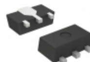
S-80860CNUA-B9LT2U SII Semiconductor Corporation IC VOLT DETECTOR 6.0V SOT89-3