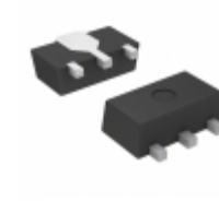
S-80860CNUA-B9LT2G SII Semiconductor Corporation IC VOLT DETECTOR 6.0V SOT89-3