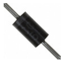
UF5406-AP Micro Commercial Components (MCC) DIODE GP 3A DO201AD