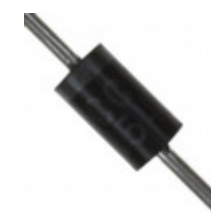
UF5405-TP Micro Commercial Components (MCC) DIODE GP 50C 3A DO201AD