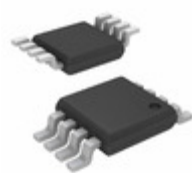
MIC3775-1.65YMM Microchip Technology IC REG LDO 1.65V 0.75A 8MSOP