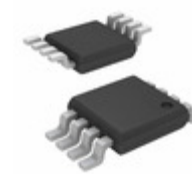
MIC3775-1.65BMM Microchip Technology IC REG LDO 1.65V 0.75A 8MSOP