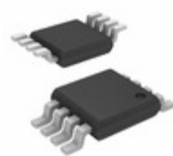
MIC3775-1.65BMM-TR Microchip Technology IC REG LDO 1.65V 0.75A 8MSOP