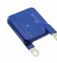
LS40K320QPK2 EPCOS (TDK) VARISTOR 510V 40KA CHASSIS