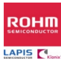
MTZJT-726.8B/6.8V ROHM MTZJT-726.8B/6.8V ROHM