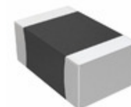
CC0805KKX7RABB682 Yageo CAP CER 6800PF 200V X7R 0805