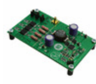
NCP3101BUCK1GEVB AMI Semiconductor / ON Semiconductor EVAL BOARD FOR NCP3101BUCK1G