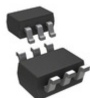
MCP40D18T-502AE/LT Microchip Technology IC POT 7BIT 5K I2C SC-70-6