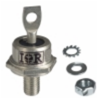
30HFU-600 Electro-Films (EFI) / Vishay DIODE GEN PURP 600V 30A DO203AB