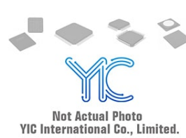
BA050LBSG-TR ROHM BA050LBSG-TR ROHM