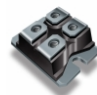
VS-UFB200CB40P Electro-Films (EFI) / Vishay DIODE GEN PURP 400V 142A SOT227