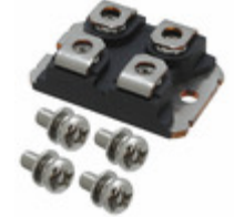
VS-UFB130FA20 Electro-Films (EFI) / Vishay DIODE MODULE 200V 65A SOT227