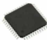
XCR3064XL-10VQ44I Xilinx Inc. IC CPLD 64MC 9.1NS 44VQFP