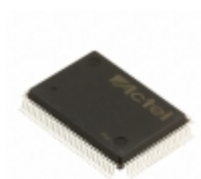
A40MX04-PQG100M Microsemi Corporation IC FPGA 69 I/O 100QFP