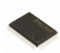
A40MX04-PQG100I Microsemi Corporation IC FPGA 69 I/O 100QFP