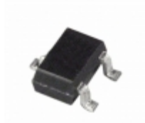
ADM1816-20AKSZ-RL Analog Devices Inc. IC MONITOR RESET 2.55V SC-70-3