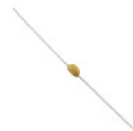
A392M20X7RL5TAA Vishay BC Components CAP CER 3900PF 500V X7R AXIAL