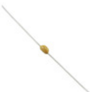
A392M20X7RL5UAA Electro-Films (EFI) / Vishay CAP CER 3900PF 500V X7R AXIAL