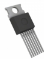
BTN7970SAKSA1 Infineon Technologies IC MOTOR DRIVER PAR TO220-7