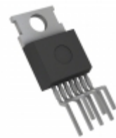
BTN7970PAKSA1 Infineon Technologies IC MOTOR DRIVER PAR TO220-7