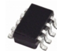
AD5620BRJ-2REEL7 Analog Devices Inc. IC DAC 12BIT SPI/SRL SOT23-8