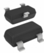
CPH3223-TL-E ON Semiconductor TRANS NPN 50V 3A CPH3