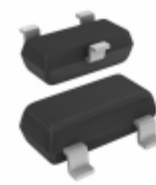
CPH3215-TL-E ON Semiconductor TRANS NPN 30V 1.5A CPH3