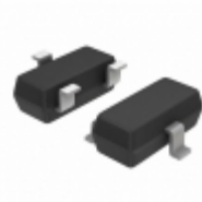
CPH3215-TL-H ON Semiconductor TRANS NPN 30V 1.5A CPH3