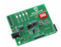
MCP23X08EV Micrel / Microchip Technology BOARD EVALUATION FOR MCP23X08