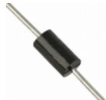
P6KE56A Fairchild/ON Semiconductor TVS DIODE 47.8VWV 77VC DO15