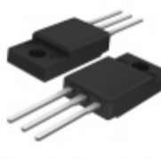
BT137X-600D,127 WeEn Semiconductors TRIAC SENS GATE 600V 8A TO220-3