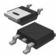
BT137S-800G,118 WeEn Semiconductors TRIAC 800V 8A DPAK