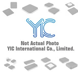
BT137X-600 PHILIPS BT137X-600 PHILIPS