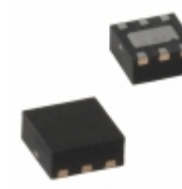
MIC5305-4.75YML-TR Microchip Technology IC REG LDO 4.75V 0.15A 6MLF