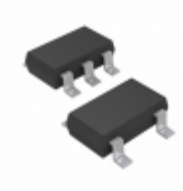
MIC5305-4.75YD5-TR Microchip Technology IC REG LDO 4.75V 0.15A TSOT23-5