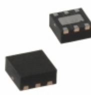
MIC5305-4.75BML-TR Microchip Technology IC REG LDO 4.75V 0.15A 6MLF