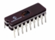
PIC16C620/JW Microchip Technology IC MCU 8BIT 896B EPROM 18CERDIP