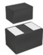
VCUT03E1-SD0-G4-08 Electro-Films (EFI) / Vishay TVS DIODE 3.3V 13V CLP0603