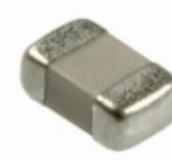
VCUG080050L1DP AVX Corporation VARISTOR 10.8V 40A 0805