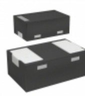
VCUT03B1-DD1-G-08 Electro-Films (EFI) / Vishay TVS DIODE 3.5V 11.5V LLP1006-2M