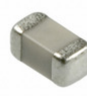
VCUG060050L1DP AVX Corporation VARISTOR 10.8V 30A 0603