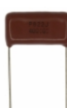
ECQ-P4822JU Panasonic Electronic Components CAP FILM 8200PF 5% 400VDC RADIAL