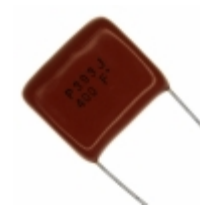
ECQ-P4393JU Panasonic Electronic Components CAP FILM 0.039UF 5% 400VDC RAD