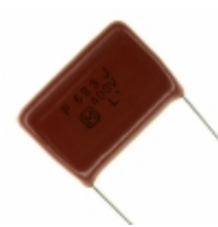
ECQ-P4683JU Panasonic Electronic Components CAP FILM 0.068UF 5% 400VDC RAD