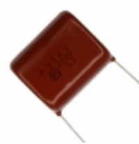
ECQ-P4334JU Panasonic Electronic Components CAP FILM 0.33UF 5% 400VDC RADIAL