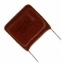
ECQ-P4473JU Panasonic Electronic Components CAP FILM 0.047UF 5% 400VDC RAD