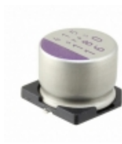
6SVPS470M Panasonic Electronic Components CAP ALUM POLY 470UF 20% 6.3V SMD