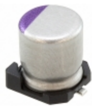
6SVPE220MW Panasonic Electronic Components CAP ALUM POLY 220UF 20% 6.3V SMD