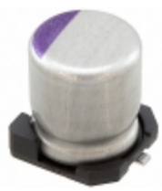
6SVPS120M Panasonic Electronic Components CAP ALUM POLY 120UF 20% 6.3V SMD