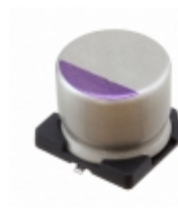
6SVQP82M Panasonic CAP ALUM POLY 82UF 20% 6.3V SMD