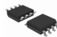
PL602-23SC-R Microchip Technology IC CLK BUFFER 200MHZ 8SOIC