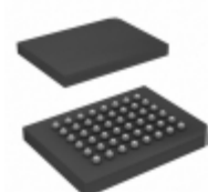
SST38VF6404-90-5C-B3KE Microchip Technology IC FLASH 64MBIT 90NS 48TFBGA