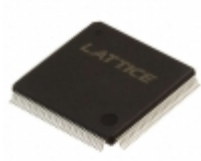
LC4128B-75T128I Lattice Semiconductor Corporation IC CPLD 128MC 7.5NS 128TQFP