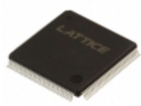
LC4128C-10T128I Lattice Semiconductor Corporation IC CPLD 128MC 10NS 128TQFP