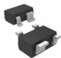
MAX6388XS26D1-T Maxim Integrated IC MPU/RESET CIRC 2.63V SC70-4