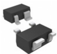
MAX6388XS25D2-T Maxim Integrated IC MPU/RESET CIRC 2.50V SC70-4