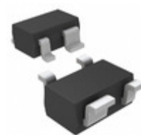
MAX6388XS26D2-T Maxim Integrated IC MPU/RESET CIRC 2.63V SC70-4