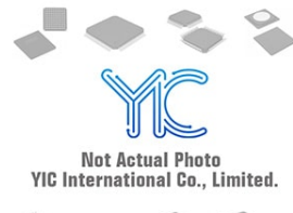
AD6315 AC AD6315 AC