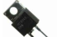
VS-ETU0805-M3 Vishay Semiconductor Diodes Division DIODE GEN PURP 500V 8A TO220AC