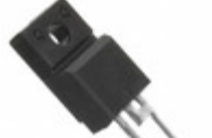
VS-ETU1506-M3 Electro-Films (EFI) / Vishay DIODE GEN PURP 600V 15A TO220-2