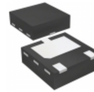
PMEG6010CPASX Nexperia USA Inc. DIODE SCHOTTKY 60V 1A SOT1061