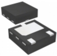
PMEG6010CPA,115 Nexperia USA Inc. DIODE ARRAY SCHOTTKY 60V 3HUSON