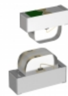
APA3010F3C-GX Kingbright EMITTER IR 940NM 50MA SMD