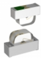
APA3010MGC-GX Kingbright LED GREEN CLEAR 2SMD R/A