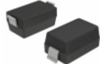
DDZ6V8CQ-7 Diodes Incorporated DIODE ZENER SOD123