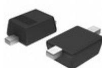
DDZ7V5ASF-7 Diodes Incorporated DIODE ZENER 7.04V 500MW SOD323F