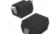
DDZ6V8CS-7 Diodes Incorporated DIODE ZENER 6.8V 200MW SOD323