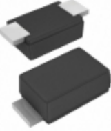
SE20FJHM3/I Vishay Semiconductor Diodes Division DIODE GEN PURP 600V 1.7A DO219AB