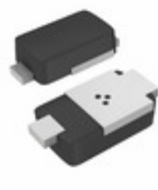
SE20PBHM3/84A Vishay Semiconductor Diodes Division DIODE GEN PURP 100V 1.6A DO220AA