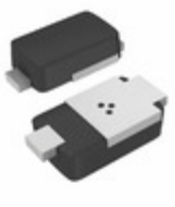
SE20PAJ-M3/I Vishay Semiconductor Diodes Division DIODE RECT 600V 1.6A DO220AA