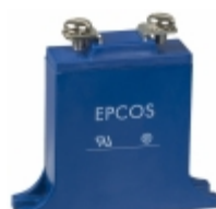
B32K320 EPCOS (TDK) VARISTOR 510V 25KA CHASSIS