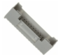
B32B-PUDSS-1(LF)(SN) JST Sales America Inc. CONN HDR TOP 32 POS W/BOSS 2MM