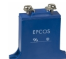
B32K420 EPCOS (TDK) VARISTOR 680V 25KA CHASSIS