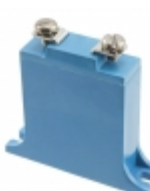
B32K385 EPCOS (TDK) VARISTOR 620V 25KA CHASSIS