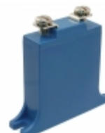
B32K250 EPCOS (TDK) VARISTOR 390V 25KA CHASSIS