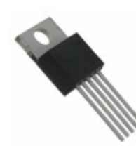
MIC29712WT Microchip Technology IC REG LDO 7.5A ADJ TO-220-5