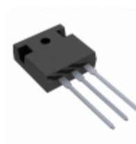
MIC29750-3.3BWT Microchip Technology IC REG LDO 3.3V 7.5A TO247-3