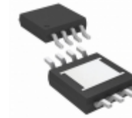
LTC3631IMS8E-3.3#TRPBF Linear Technology IC REG BUCK INV 3.3V 0.1A 8MSOP