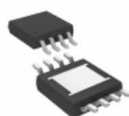
LTC3631IMS8E#PBF Linear Technology IC REG BUCK INV ADJ 0.1A 8MSOP