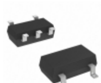
MIC5213-1.8BC5-TR Microchip Technology IC REG LDO 1.8V 80MA SC70-5