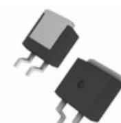
DGS20-018AS IXYS DIODE SCHOTTKY 180V 23A TO263AB