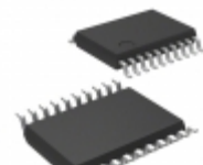
MCP4451-503E/ST Microchip Technology IC POT 50K QUAD 8BIT 20TSSOP