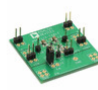
ADP7112CB-EVALZ ADI (Analog Devices, Inc.) EVAL BOARD FOR ADP7112