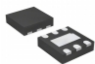
ADP7118ACPZN-R7 Analog Devices Inc. IC REG LDO ADJ 0.2A 6LFCSP