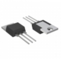
QK006RH4 Littelfuse Inc. TRIAC ALTERNISTOR 1KV 6A TO220