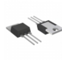
QK006LH4 Littelfuse Inc. TRIAC ALTERNISTOR 1KV 6A TO220